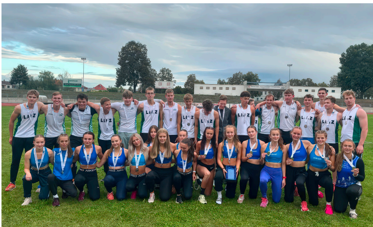
Junioři Jablonce a juniorky Turnova se stříbrnými medailemi na mistrovství Čech v Pardubicích