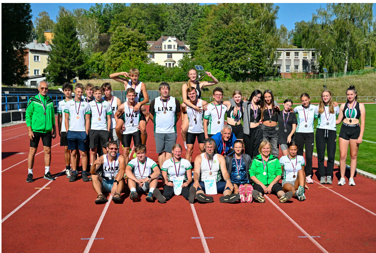
B družstva mužů a žen po závěrečném 5 kole v Rumburku